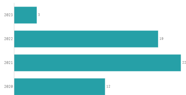
Manifestação por Ano